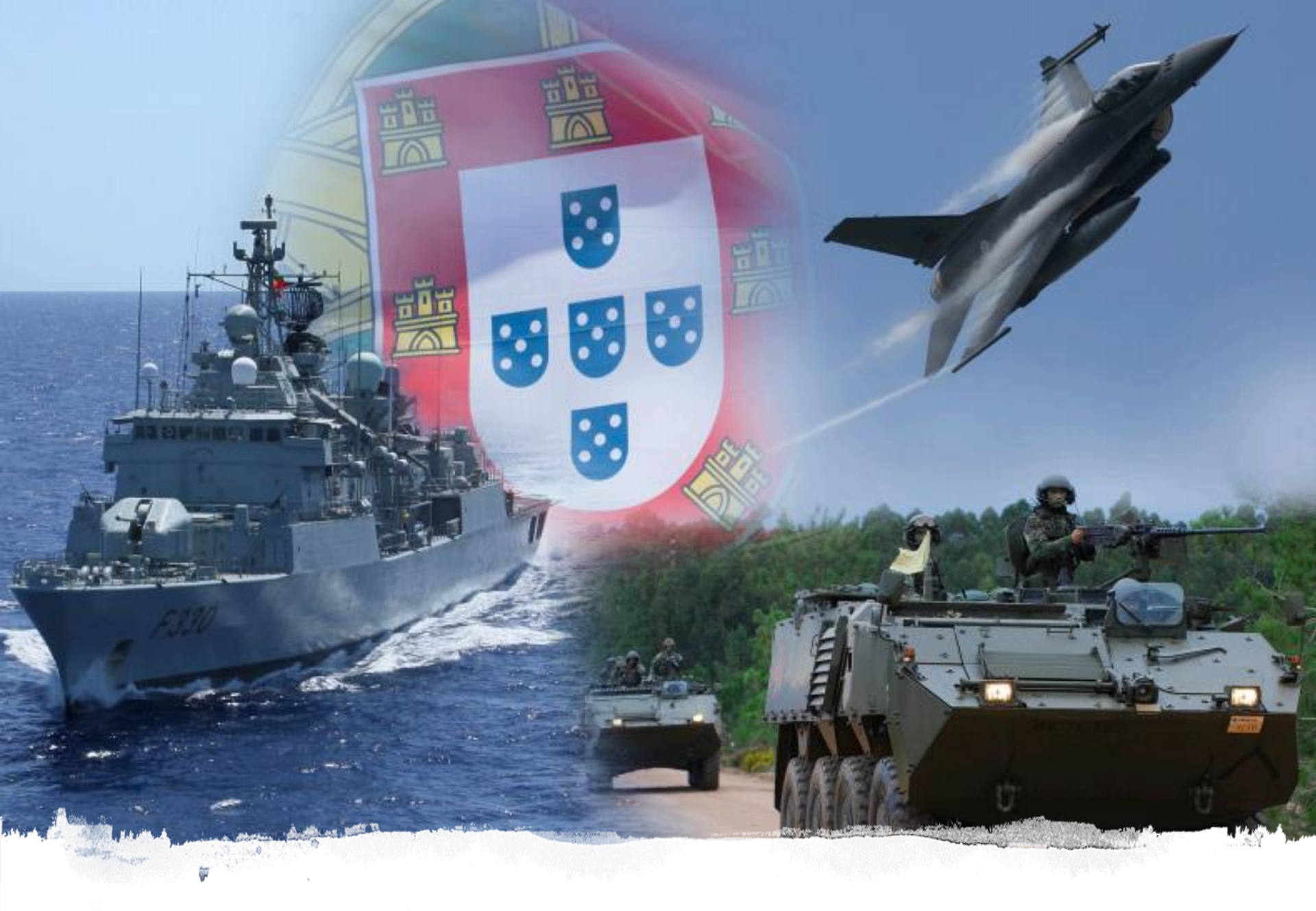
Promoting interoperability in times of crises